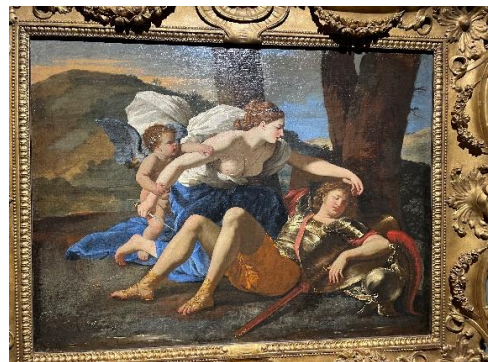
Renaud et Armide vers 1628

A voir aussi dans la continuité de l'exposition Poussin et l'amour, une exposition-dossier de PICASSO qui s'est inspiré de POUSSIN entre le 19 et 25 août 1944 pour la réalisation de quelques œuvres dont « Le Triomphe de Pan ». A cette période lors de son arrivée à Paris, Picasso était fasciné par Poussin qu'il voit au Louvre.