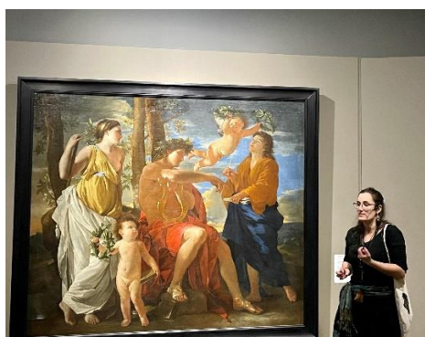
L'Inspiration du poète vers 1628-1629