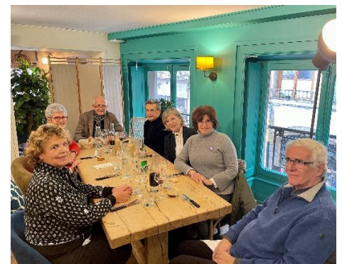
Après la visite de l'exposition moment de détente avec un déjeuner conviviale au restaurant « Café Chenavard »