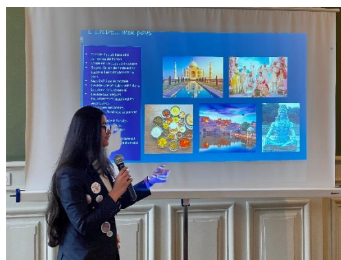
Exposé de Mahak (Inde)