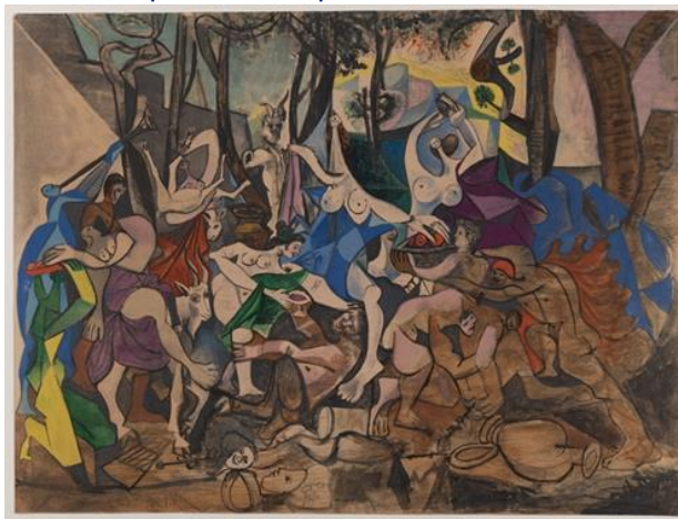
Pablo Picasso, Bacchanale : Le Triomphe de Pan (D'après Poussin), Paris, 24-29 août 1944.