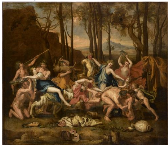
Nicolas Poussin, Triomphe de Pan, 1636

A voir aussi dans la continuité de l'exposition Poussin et l'amour, une exposition-dossier de PICASSO qui s'est inspiré de POUSSIN entre le 19 et 25 août 1944 pour la réalisation de quelques œuvres dont « Le Triomphe de Pan ». A cette période lors de son arrivée à Paris, Picasso était fasciné par Poussin qu'il voit au Louvre.