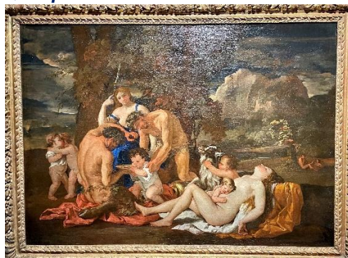
Vénus épiée par deux Satyres vers 1626